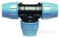
Тройник компрессионный до 63 диаметра PN16, 75-110 - PN10.